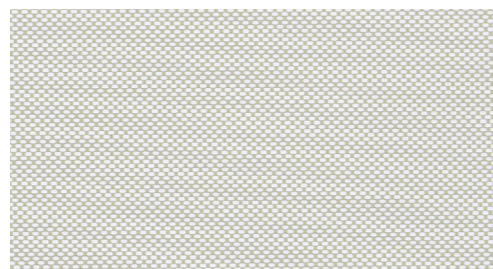
1012 Beige / Vit