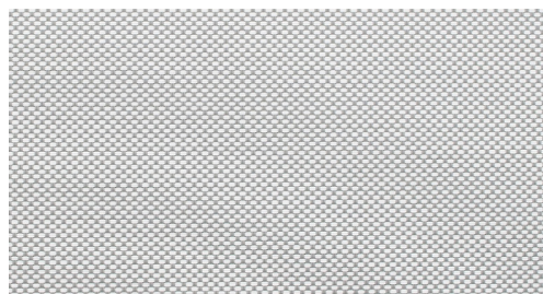
1013 Grå / Vit

För helt korrekt färgvisning och struktur, se/beställ varuprov.